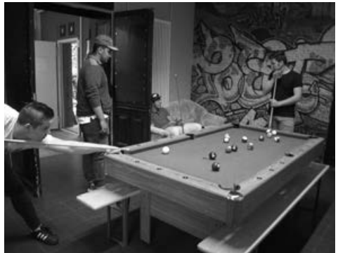
Text & Fotos: Jugendtreff „Mars“ Kleinheubach