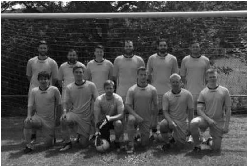
Sieger der Ortsmeisterschaften: Team „Fleischwurst and Friends“