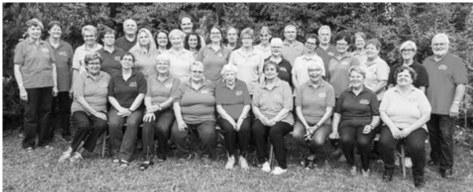
Text & Foto: Chor „Canta Nova“, Kleinheubach