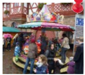
Kinderkarussell für die kleinen Besucher